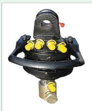
OPTIONAL: rotore idraulico